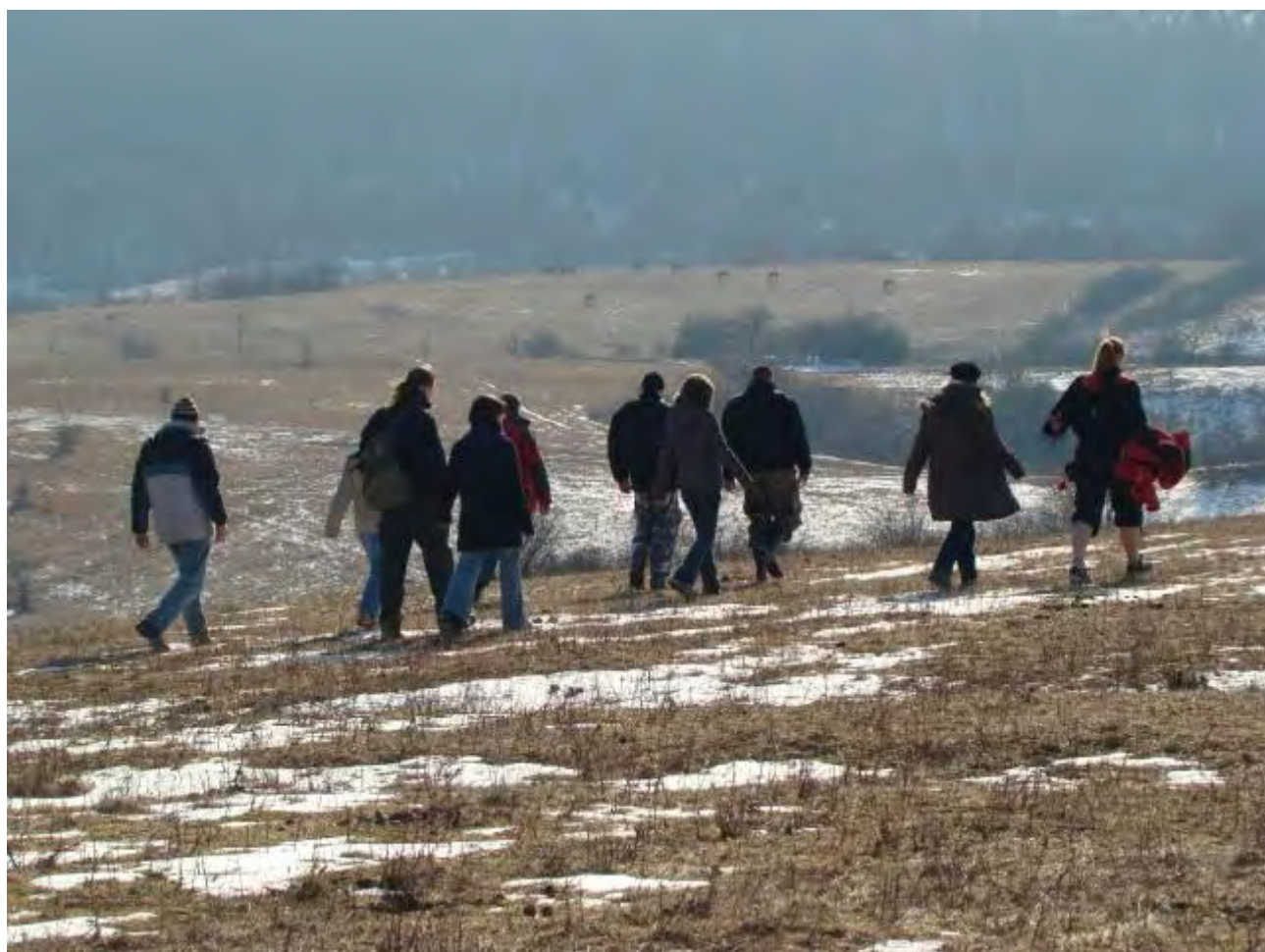
A több évtizede működő Természetjáró szakosztály kirándulása a Bükkben